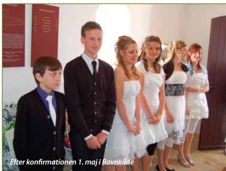
Efter konfirmationen 1. maj i Ravnkilde