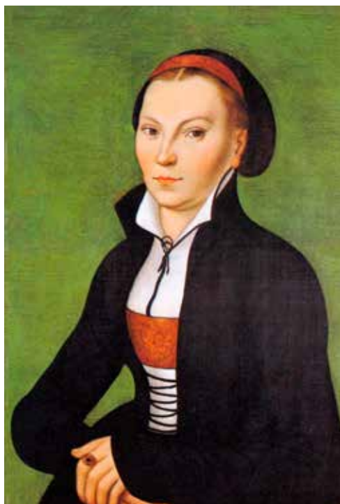
Katharina von Bora

I 1525 gifter han sig med Katharina von Bora, en tidligere nonne der har forladt klosteret på grund af