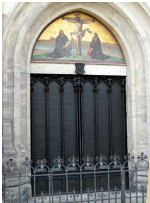
Teserne på kirkedøren

I efteråret 1517 skriver Martin Luther sine 95 teser imod afladen og de bliver opslået på døren til slotskirken i Wittenberg. Teserne bliver hurtigt spredt over det meste af Tyskland på grund af den nye bogtrykkerkunst. Teserne vækker straks røre i Rom, og snart indledes en kætterproces mod Luther. I 1520 udsteder paven en bandbulle, hvor han giver Luther 60 dage til at tilbagekalde teserne, og ellers vil han blive smidt ud af kirken. Luther svarer ved at brænde bulle offentlig og et halvt år senere bandlyser paven ham af den katolske kirke. Reformationen er for alvor i gang.