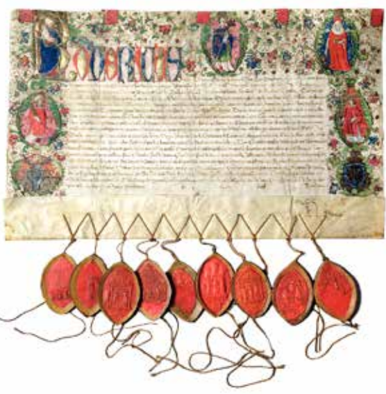
Aflatsbrev anno ca. 1500